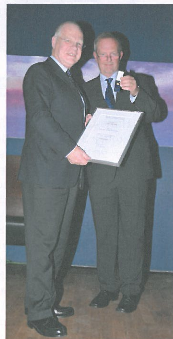
Die Ausgezeichneten der drei Stiftungen