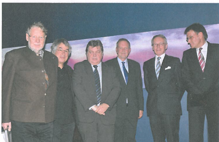
Die neuen Ehrennadel-Träger der FGSV