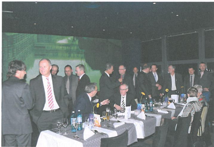
FGSV-Abend auf dem Dach des Panorama-Towers „Plate of Art“

Die Leiterinnen und Leiter der FGSV-Gremien sowie der FGSV-Vorstand, die Ehrenmitglieder sowie ausländische Gäste treffen auf Einladung des Vorsitzenden der FGSV, am Vorabend des Kongresses zu einem festlichen und geselligen Abendessen zusammen. Erstmals werden in diesem prominenten Rahmen auch die FGSV-Ehrennadeln verliehen und die Auszeichnungen der von der FGSV verwalteten Stiftungen feierlich überreicht. ◀