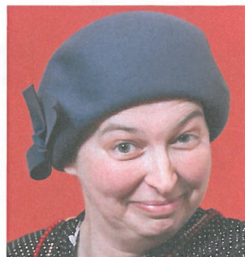
Stadtrundgang auf „säggs'sch“

Traditionell ist der Start vor dem Fachprogramm: der Stadtrundgang. Und in Leipzig wurden die Sehenswürdigkeiten einzigartig präsentiert: ein Kabarettistischer Stadtrundgang von einem Leipziger Urgestein. Das Team der FGSV hat zudem weitere, attraktive Ziele ausgewählt, die das Programm für Begleitpersonen auch mit Ausflügen in die Umgebung sehr abwechslungsreich und informativ gestalten. BlitzRevue 2012 ist von der Schönheit und der Vielfalt von Stadt und Region begeistert. ◀