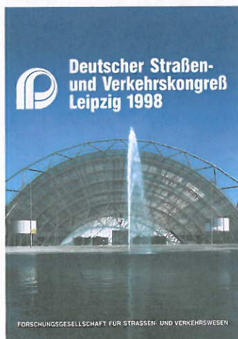
Der FGSV-Kongress war zuvor 1998 in Leipzig

1986 Würzburg 1988 Berlin 1990 Nürnberg 1992 Hamburg 1994 Karlsruhe 1996 Düsseldorf 1998 Leipzig 2000 Hamburg 2002 München 2004 Berlin 2006 Karlsruhe 2008 Düsseldorf 2010 Mannheim 2012 Leipzig